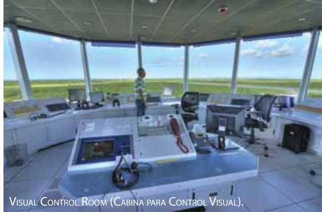
VISUAL CONTROL ROOM (CABINA PARA CONTROL VISUAL).